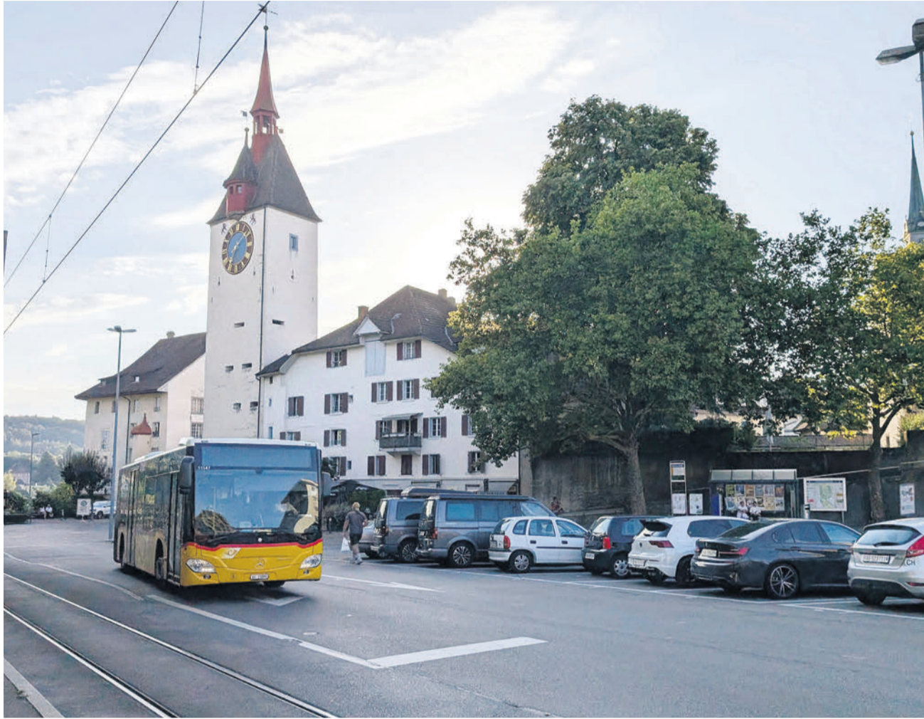
Bus, Zug, Auto, Fussgänger – der Obertorplatz wird heute vielfältig genutzt – wobei sich die Verkehrsteilnehmenden gegenseitig einschränken und ein Sicherheitsrisiko darstellen. Das ist so nicht mehr gesetzeskonform. Wie auch die (beim Bus nicht vorhandenen) Einstiegsmöglichkeiten, die dem Behindertengleichstellungsgesetz zuwiderlaufen.

sondern darum, die Bevölkerung von der Richtigkeit und Wichtigkeit der Vorhaben zu überzeugen – und mit Zweifeln und Ängsten im Hinblick auf die ausserordentliche BNO-«Gmeind» am 24. Oktober aufzuräumen. Gross ist der Respekt davor, dass das neue Regelwerk, das die Leitplanken für die städtische Entwicklung in den nächsten 15 Jahren setzt, aufgrund von einzelnen Aspekten so viel Gegenwind erfährt, dass es nach Jahren der akribischen Arbeit vor dem Souverän Schiffbruch erleiden könnte. Dem will